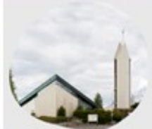
Bärderstraße 3 Kemel