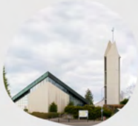
St. Michael Bäderstraße 3 65321 Heidenrod Kemel