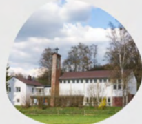
St. Klemens Maria Hofbauer Backhausstraße 10 65329 Hohenstein Breithardt