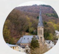
Herz Jesu Rheingauer Str. 21 65388 Schlangenbad