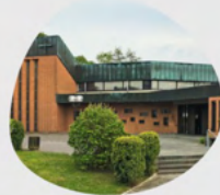
Herz Mariae Mainzer Allee 38 65232 Taunusstein Wehen