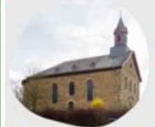
Gronauerweg 1 Laufenselden