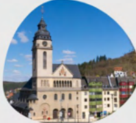
St. Elisabeth Kirchstraße 7 65307 Bad Schwalbach