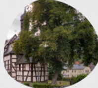
St. Josef Graf-von-Galen-Straße 5 65326 Aarbergen Daisbach