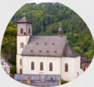
St. Ägidius Ägidiusstraße 1 A 65388 Schlangenbad Niedergladbach