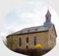
St. Philippus und Jakobus Gronauer Weg 1, 65321 Heidenrod Laufenselden