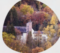
St. Bonifatius Bonifatiusstraße 1 65326 Aarbergen Michelbach